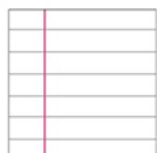
C righe 4 ^ - 5 ^ elementare * margini sinistra e destra